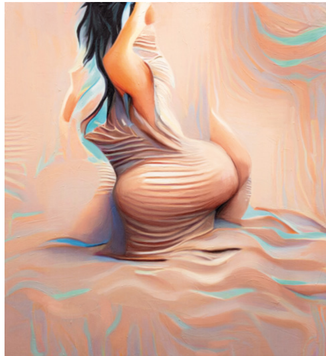
Anaïs Goupy, Kim, 2022, Acryl, Inkjet Print auf Leinwand 130 x 120 cm

Begrenzte Plätze, Buchung ab 1.10. auf unserer Website