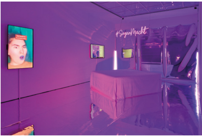
Faina Yunusova, #SugarMacht, 2021, Raum-/Mixmedia-Installation © Faina Yunusova, Installationsansicht, Frankfurter Kunstverein